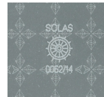
SOLAS product identification pattern

Prismatic Retro-Reflective Films for use on Maritime aids to navigation (M82), SOLAS Type I and Type II PFDs (FD1403), and SOLAS Type I Inflatable PFDs (FD1404).